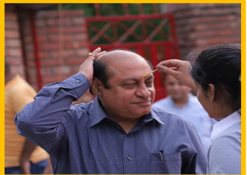
A Believer of Cultural Ethos