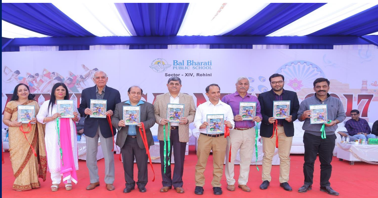
An Empathetic Leader