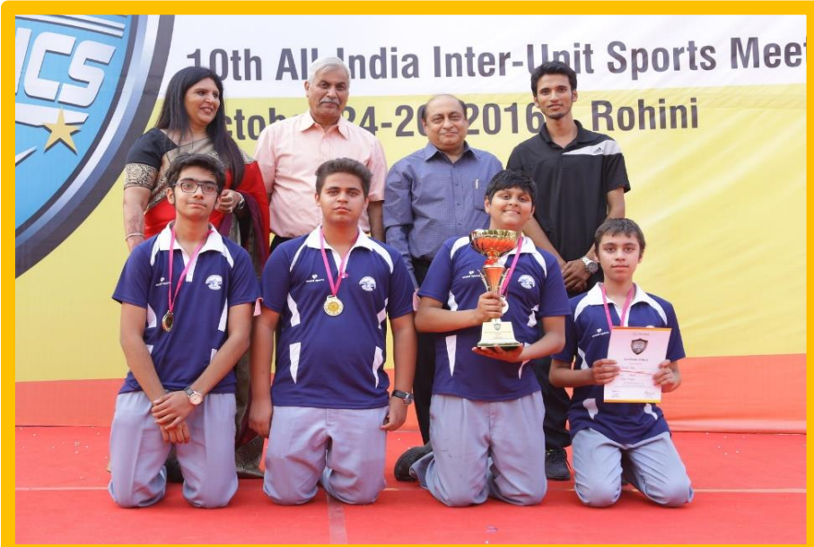
A Pillar of Strength