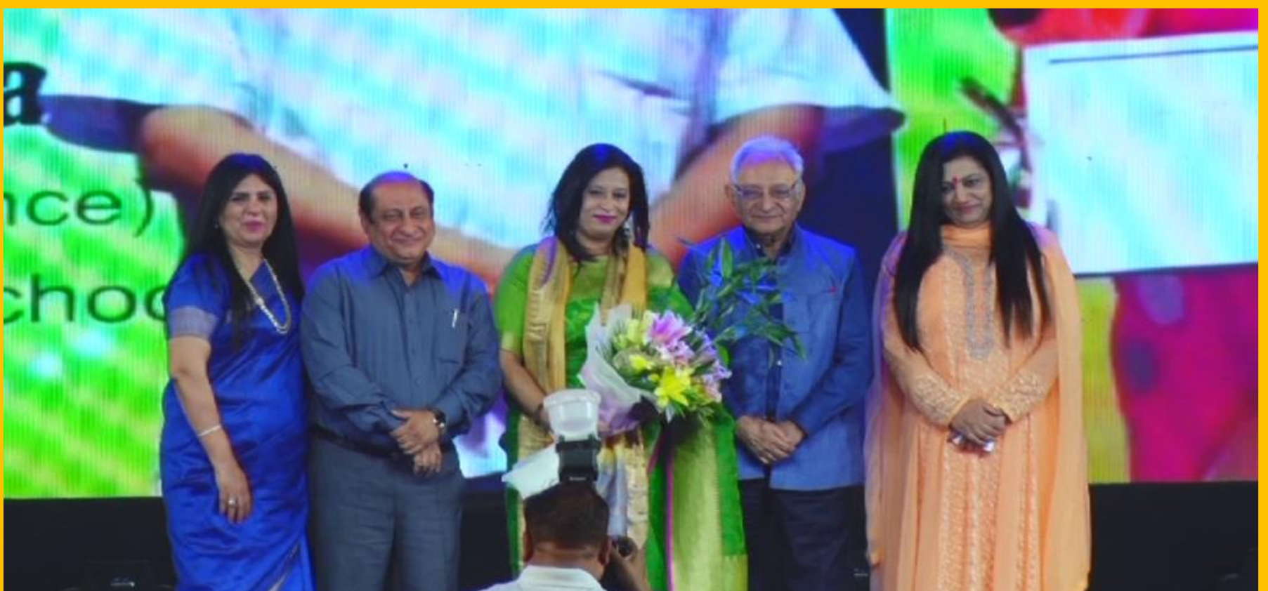
An Enthused Visionary