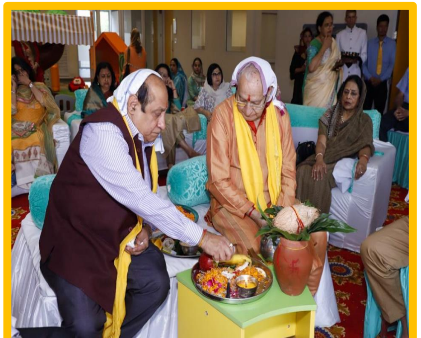
A Custodian of Tradition