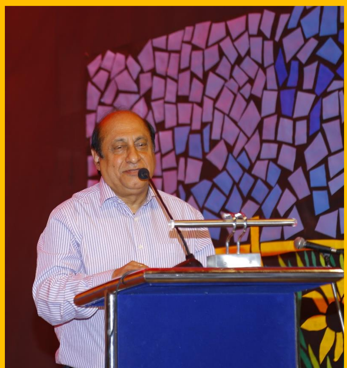
An Eloquent Orator