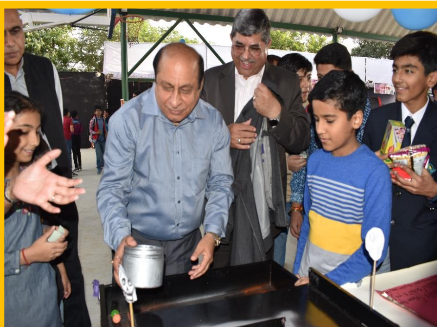
A Crusader of Modern Technology