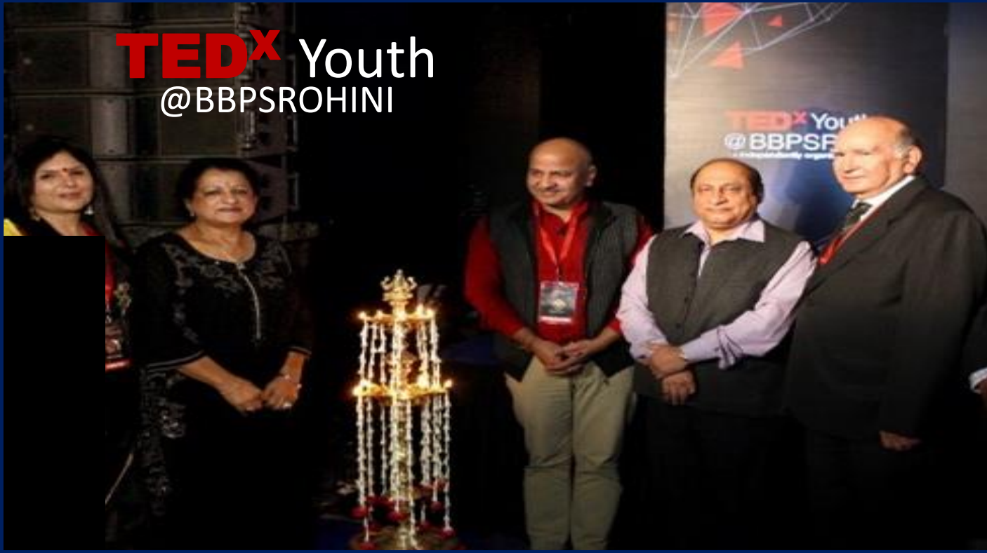
An Enterprising Educationist