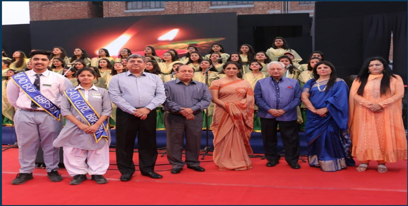
A Stalwart Mentor