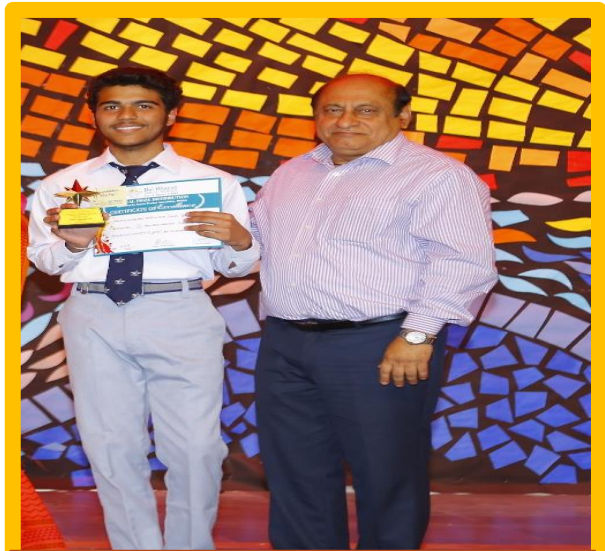
A True Inspiration