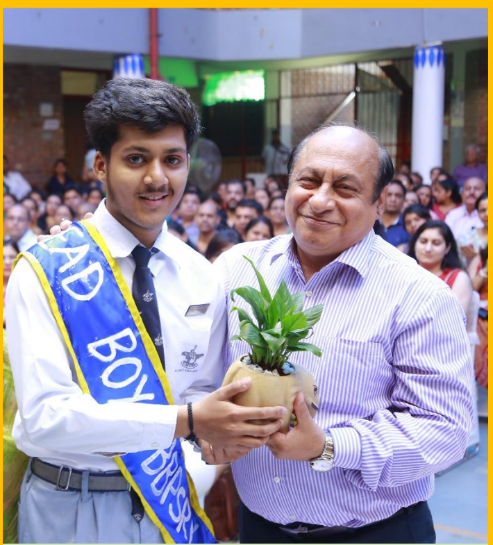
A Guiding Force