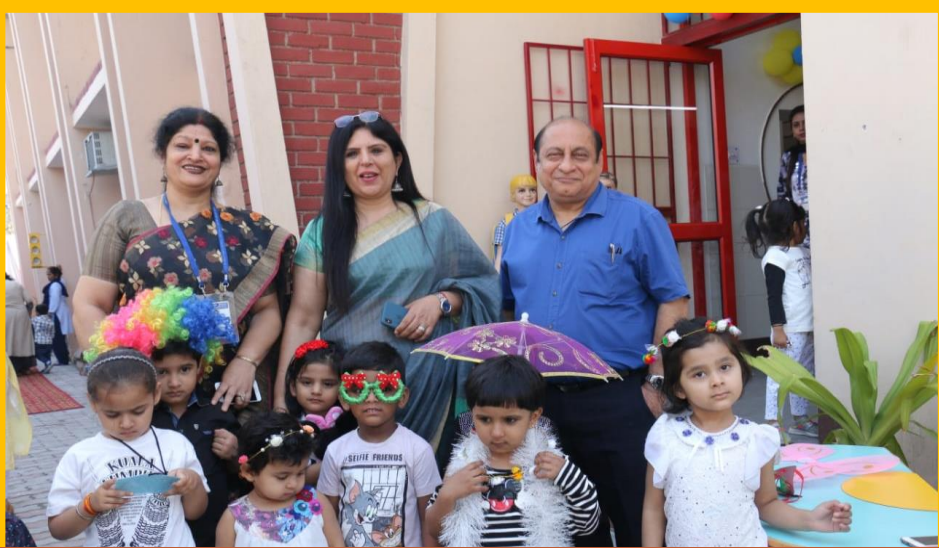
An Affable Soul